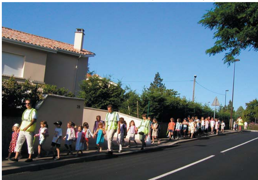
Parents et enfants sur le chemin de l'école.

Rejoignez les autres parents avec vos enfants. Il vous suffit de choisir librement votre jour d'accompagnement.