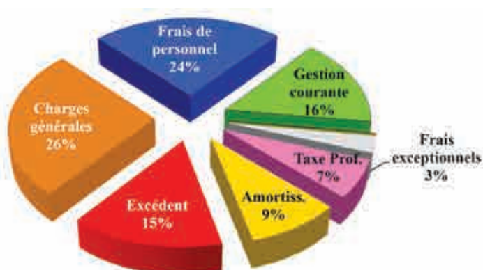
Ventilation des dépenses de fonctionnement en 2018

Les dépenses de fonctionnement s'élèvent en 2018 à 6,05 M€ se répartissant entre le fonctionnement réel, les dépenses de personnel et les amortissements.